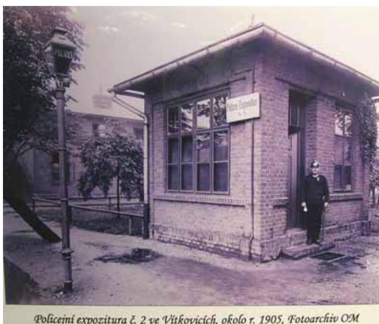
Policejní expozitura č. 2 ve Vítkovicích, okolo r. 1905